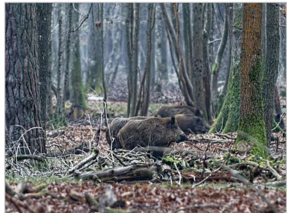
Sanglier - Sus scrofa

Ce document dresse la liste taxonomique des espèces de mammifères continentaux recensées sur le territoire aquitain. Pour chaque taxon des informations statutaires sont également renseignées (occurrence, reproduction, indigénat...). Ce référentiel doit être considéré comme un outil de connaissance à l'échelle régionale, permettant notamment à l'ensemble des acteurs de travailler sur une liste commune d'espèces. Cette liste devra être mise à jour en fonction des nouvelles données et des évolutions taxonomiques.